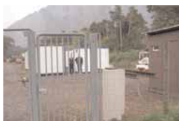
Waldau: Container als neue Heimat

Die Container sind von morgens 8 Uhr bis abends 17 Uhr zu und für die Leute nicht zugänglich, es gilt ein absolutes Besuchsverbot. Fernsehen ist verboten, es hat kein Nottelefon, keinen Briefkasten, und man kann die Container auch nicht abschliessen, um das wenige Hab und Gut sicher zu verwahren. Nicht mal einen Feuerlöscher hat der sonst so ordnungsliebende und sicherheitsbewusste Kanton für die unerwünschten Flüchtlinge übrig.