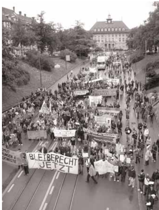
Bleiberechts-Demo: Die Spitze des Protestmarschs

ziell und logistisch unterstützen könnte; sie sind aufgrund der erlittenen Strapazen oft psychisch und körperlich angeschlagen. Aus all diesen Gründen ist es für Flüchtlinge kaum möglich, neben dem Studium zu jobben, und sie sind auf Unterstützung angewiesen – durch den Staat, der sie aufgenommen hat, um ihnen ein neues Leben in Sicherheit und Würde zu ermöglichen.