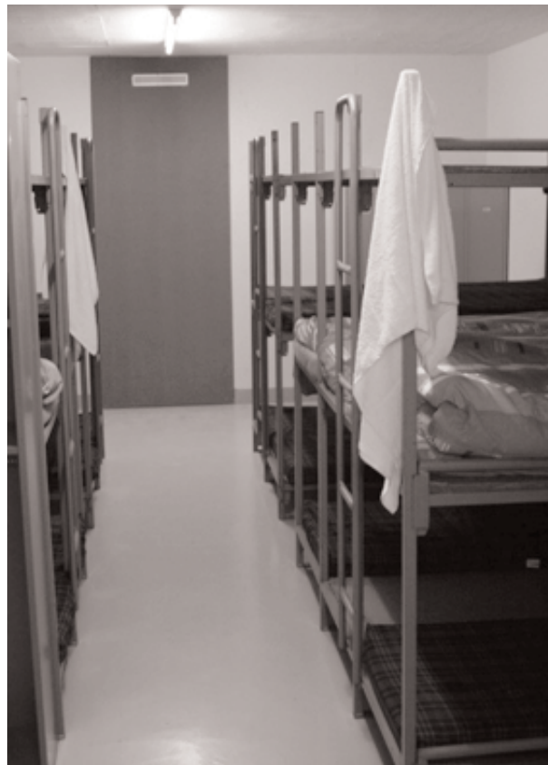
Unterirdisch, ohne Tageslicht und frische Luft: Unterkunft für Flüchtlinge an der Effingerstrasse in Bern

Für augenau ist klar, dass das kurzfristige Spardenken in der Asylpolitik und die miserablen Zustände bei der Unterbringung der