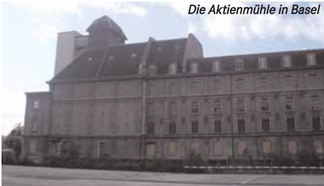
Die Aktienmühle in Basel

Während des Euro-Endspiels besetzten AktivistInnen die seit Jahren leerstehende Aktienmühle im Kleinbasel. Die Polizei fand das nicht lustig und jagte ZuschauerInnen mit Hunden.